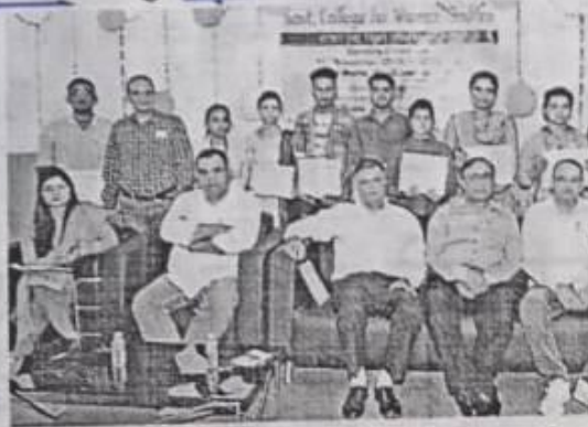
राजकीय महिला महाविद्यालय में विजेता छात्राओं के साथ प्राचार्य।